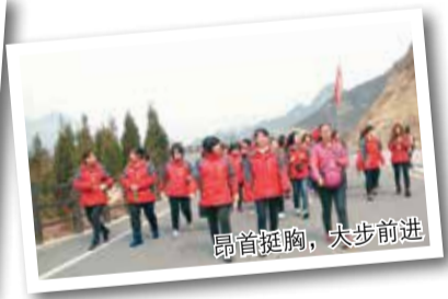
昂首挺胸，大步前进