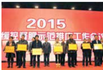
表彰2014年缓释肥料推广先进单位