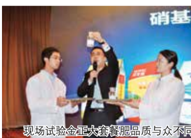
现场试验金正大套餐肥品质与众不同

本报讯 通讯员王鲁阳报道 3月13日，套餐肥全球启动大会在广东省英德市召开，套餐风暴再次席卷华南。来自广东、海南等地的400多位经销商和媒体代表参加了大会。