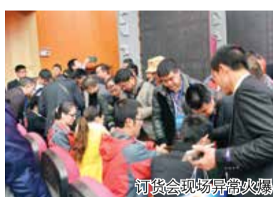
订货会现场异常火爆

本报讯 通讯员王鲁阳报道 3月16日，金正大套餐肥新品发布会贵州站隆重开幕，来自贵州、云南、广西、四川、重庆、湖南等地的经销商300余人齐聚瓮安，“拥抱套餐时代”，一场套餐风暴即将席卷中国西南部这片丰饶的土地。