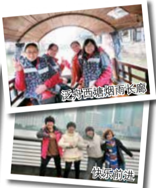
泛舟西塘烟雨长廊