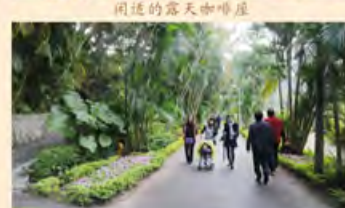
曾经的私人花园已向公众开放