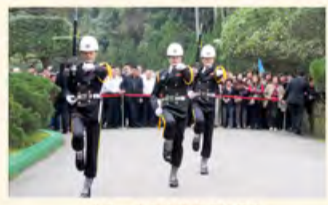
威严、庄重的陵寝守护卫队