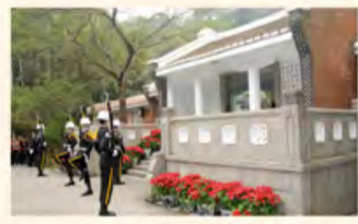
在这里沉睡着一个时代的记忆