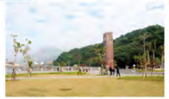
依山傍水的国立中山大学