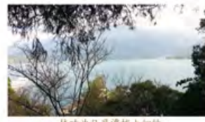
枝叶为日月潭披上纱幔