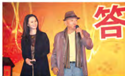
台湾著名歌手凌峰夫妇在晚宴上倾情演出