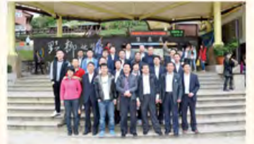
野柳地质公园前的合影