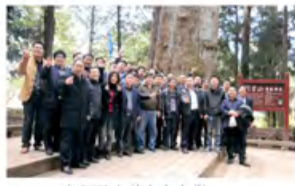
与阿里山神木合影留念