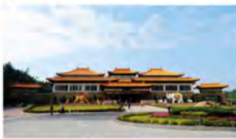
龙珠菩萨，普贤菩萨的座骑所镇守的宝殿