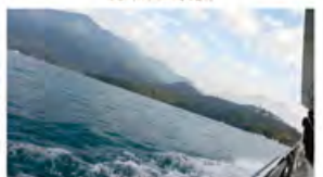
别样角度：船行中的日月潭