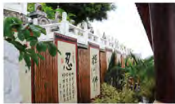
随处可见的星云法师的墨宝