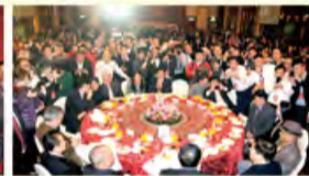
郝市长成为了晚宴现场的焦点