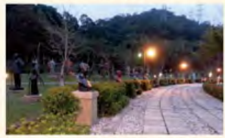
傍晚，幽径—慈湖中正铜像陈列其间