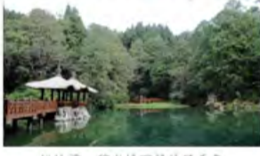
姐妹潭：碧水情深静待了千年