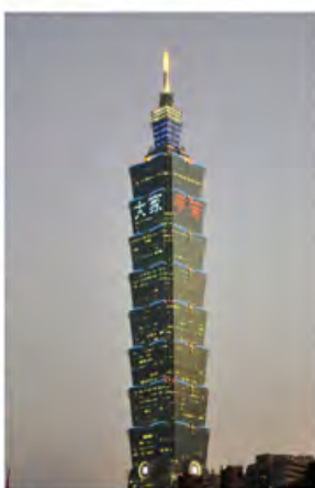
夜幕中霓虹闪烁的台北101大楼