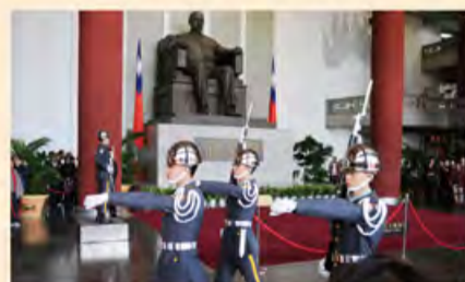
庄严肃穆的国父纪念馆内景