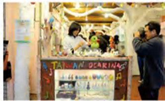
现场制作艺术品，太真的！