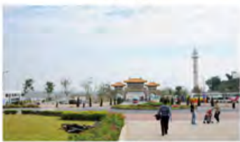
佛光普照下的大千世界