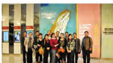
“台湾之光”下的合影