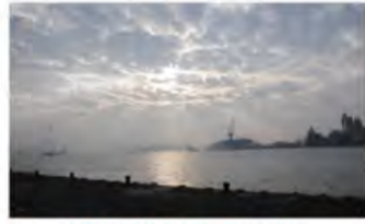
夜幕为西子湾筑上了一层神秘面纱