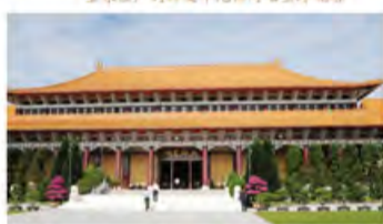
佛光山主殿：大雄宝殿外景