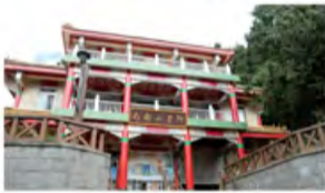
玲珑别致，古色古香的阿里山邮局