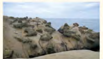
野柳地质公园奇特景观