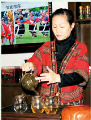
邹族部落的特色茶文化