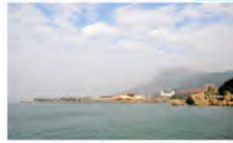
青山，绿水，白云尽收眼底