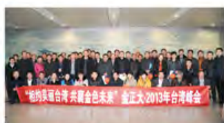
从烟台莱山机场出发