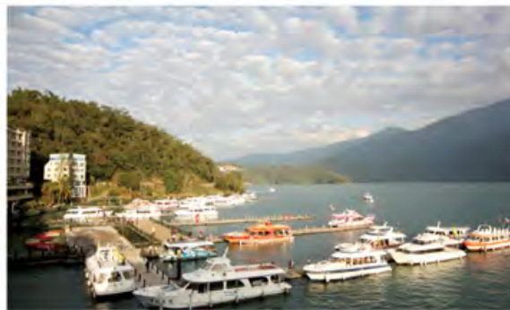
云海缭绕，百舸待发，点缀万千丰富多变的日月潭