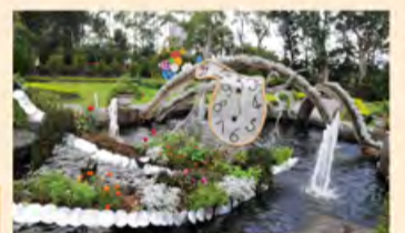
“达利之时”在此定格