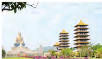
宝象庄严的释迦牟尼佛与七宝玲珑塔