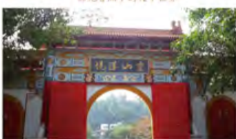
磅礴的气势，贤者的慧山，净化心灵在此间