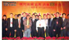
台北市长郝龙斌先生与出席晚宴的嘉宾、经销商合影留念