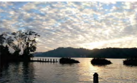
层林晚染，幽幽静水，秀美日月潭