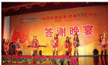
古典与现代相结合演绎而成的青春靓丽的合奏曲