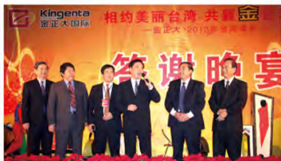
台北市长郝龙斌先生出席晚宴并发表热情致辞