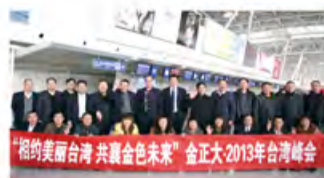
从济南遥墙机场出发