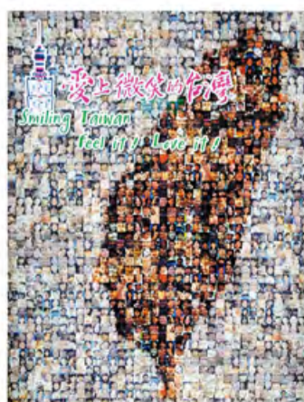
101大楼里的海报：爱上微笑的台湾