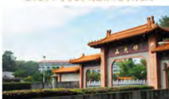
山门镇联：佛光普照三千届，法水长流五大洲