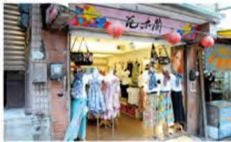
如今的花木兰也爱花衣裳