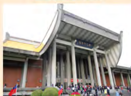
磅礴大气的国父纪念馆外景