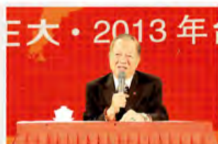
管理学、国学大师曾仕强教授作专题讲座