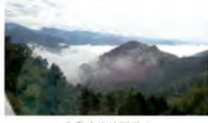
云雾缭绕的阿里山