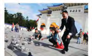
喜悦的人群，悠闲自在的鸽子