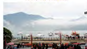
云雾缭绕的日月潭全景