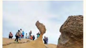
地质公园的名片：优雅端庄，维妙维肖的女王头