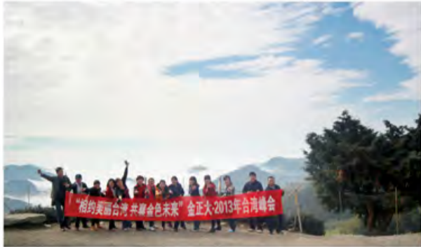
阿里山之巅：青春在此刻飞翔