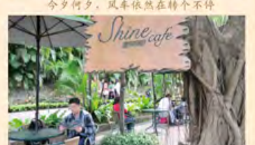
别具风格的官邸咖啡