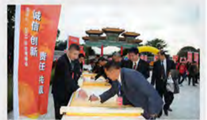
参会人员签名留念