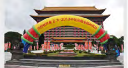
台湾峰会圆山饭店会议主场外景