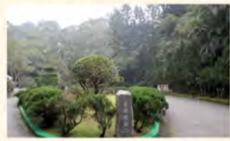
古木深深，幽静典雅的慈湖陵寝