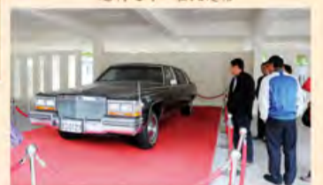
历史的记忆：宋美龄当年的座驾