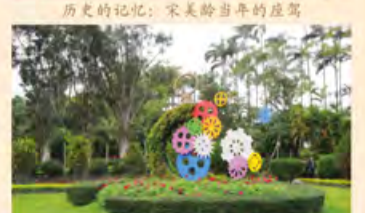
今夕何夕，风车依然在转个不停