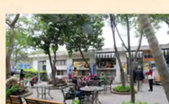
闲适的露天咖啡馆