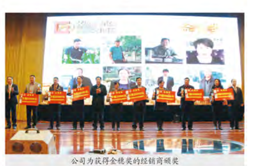
公司为获得金熊奖的经销商颁奖