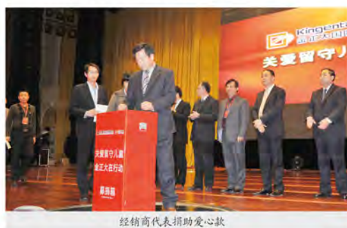
经销商代表捐助爱心款