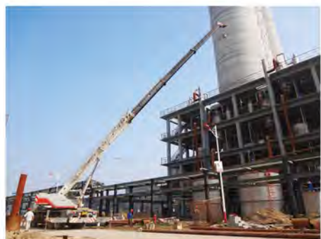
菏泽公司项目建设场景