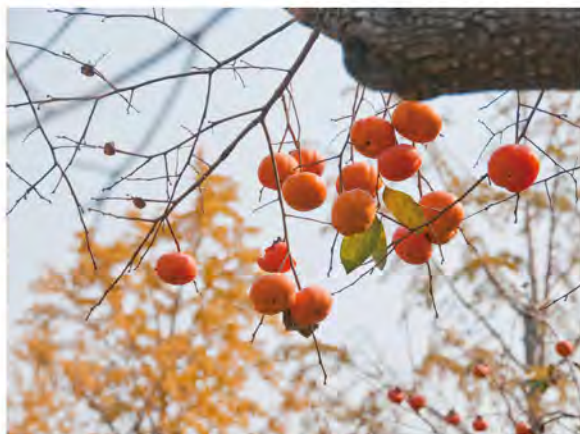
“柿柿”如意