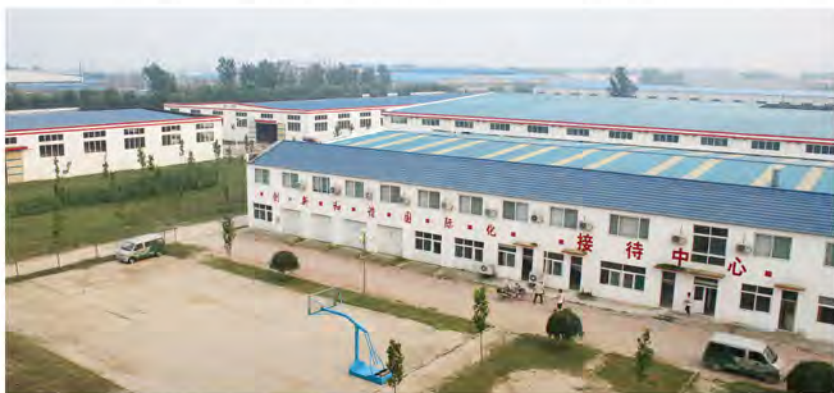
德州公司厂区一角