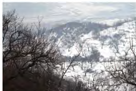
银装素裹 (辽宁公司李庆华拍摄于铁岭冰砬子山)