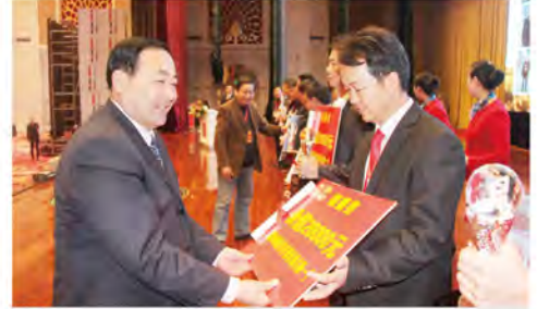
公司领导为优秀经销商颁奖