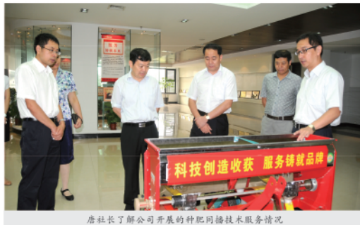
唐社长了解公司开展的种肥同播技术服务情况

唐社长一行先后参观了公司生产园区、国家缓控释肥工程技术研究中心和产品展厅，现代化的生产线、规模宏大的生产园区给唐社长留下了深刻印象。在参观公司产品展厅时，唐社长详细地询问了公司肥料技术研发、生产、推广应用等情况。展厅中摆设的种肥同播机引起了唐社长的关注，他走上前了解种肥同播技术原理、推广及农民增产增收情况。在得知2012年公司以种肥同播为技术载体，在全国范围内开展规模最大的配方肥推广活动，来加强农民