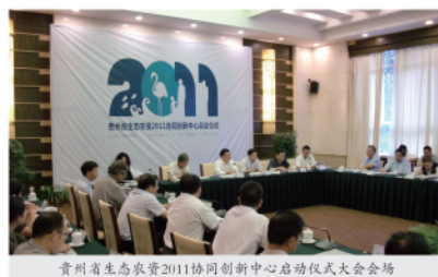
贵州省生态农资2011协同创新中心启动仪式大会会场

本报综合讯 9月4日，贵州省生态农资2011协同创新中心在贵州大学举行了启动仪式。贵州省教育厅副厅长代其平、贵州大学党委书记姚小泉、贵州省委常委、副省长胡继成、贵州省科技厅副厅长苏庆、中国科学院院士康乐、中国工程院院士陈宗懋、荣廷昭、李正名、陈剑平、钱绪红等领导和专家出席了仪式。公司副总裁陈宏坤、胡兆平应邀参加了该仪式。