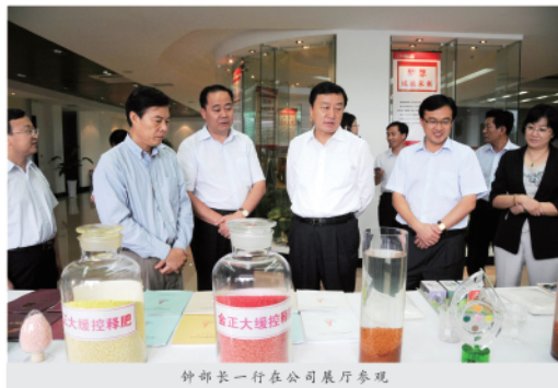
钟部长一行在公司展厅参观

在公司展厅，钟部长一行听取了公司工作人员关于企业发展历程、产品创新、技术研发、平台建设、企业文化等方面的情况介绍，钟部长一