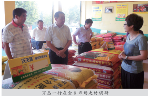
万总一行在金乡市场走访调研

本报综合讯 近期，为深入了解客户的意见与建议，更好地服务于营销工作，全力支持营销突破，打好秋季市场攻坚战，公司组织非营销系统副总监及以上人员开展秋季市场走访调研活动，要求通过调研了解市场的真实现状和需求，提出有效的意见与建议，提交有价值的调研报告。