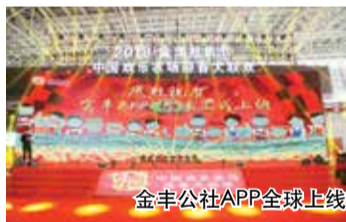
金丰公社APP全球上线