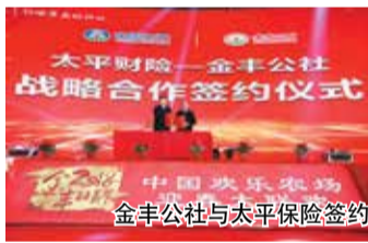
金丰公社与太平保险签约