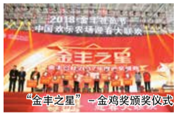
“金丰之星”-金鸡奖颁奖仪式