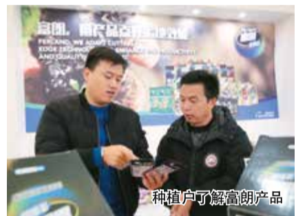
种植户了解富朗产品

为切实解决土壤改良“最后一公里”的问题，2018年起，富朗计划投入1000万用于推广亿亩良田守护计划”公益行动。据了解，富朗将在全国开展1000场农民培训会，帮助种植户深入了解土壤健康知识和亲土种植理念；同时，富朗将与农业部耕地质量监测保护中心举办土壤改良公益活动，配合开展农化技术服务，还会建设耕地质量监测网点和土壤信息数据库、联合申报或实施国家相关项目。