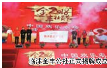
临沭金丰公社正式揭牌成立